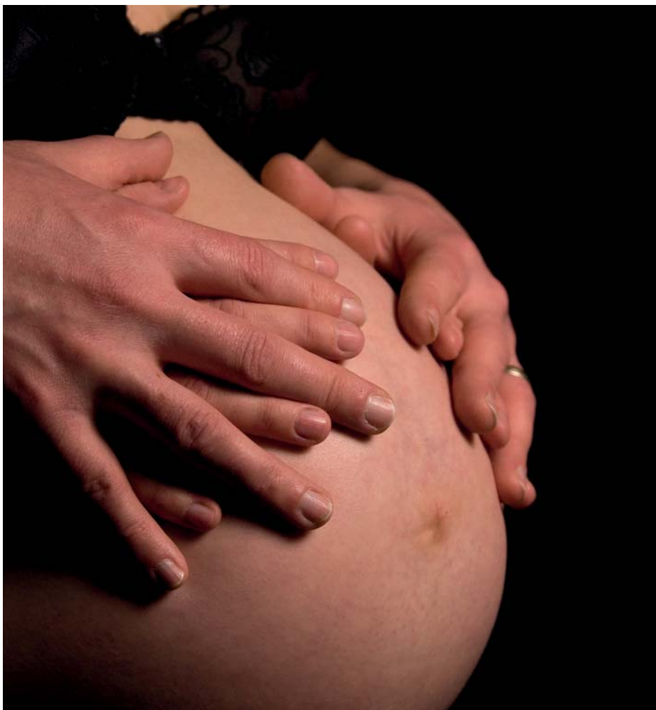
Das Reich Gottes ist zwar bereits eingeführt, aber wir warten auf seine Vollendung

wenn davon die Rede ist, dass das Reich Gottes bereits existiert, aber noch nicht in Vollkommenheit. George Ladd's sorgfältig recherchiertes Werk untermauert diese Sichtweise aus der Perspektive vieler streng gläubiger Christen zumindest in der englischsprachigen Welt (s.a. Grace Communion International auf www.gci.org/gospel/kingdom ).